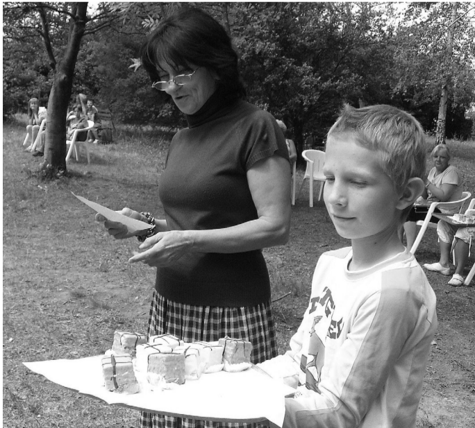
Süti jutalom járt a szereplésért

A gyermeki mosoly és szeretet, a közösség formálása, a közösen megélt élmények, melyre felnőttek korukban is szívesen emlékeznek vissza a régi táborozók. Az ápolat fáserdős természeti környezet, a változatos programok az, ami vonzó tanulónak, szülőnek egyaránt. A reggeli tornát követően szabadon választható