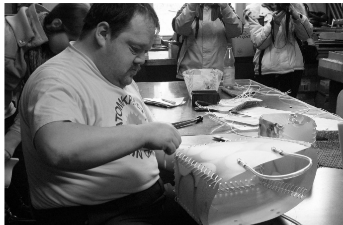
A szatyor készítéséhez erős kezekre van szükség